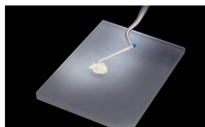
La viscosidad de Endomethasone N disminuye si usted utiliza la técnica de condensación lateral o vertical para cubrir completamente los conos de gutapercha